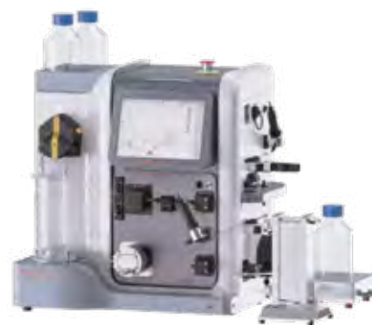
Unique AutoTFF™075-MD Мембранный насос + опции