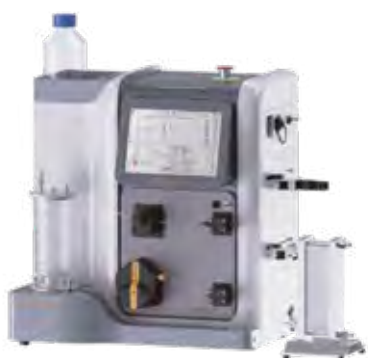
Unique AutoTFF™075-L Базовая версия с перистальтическим насосом