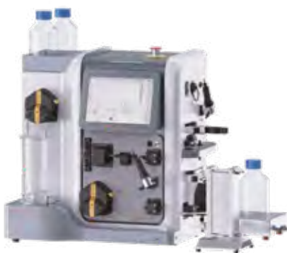
Unique AutoTFF™075-M Перистальтический насос+ опции